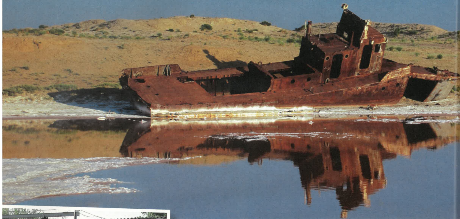
Smutné pobřeží jezera Aral