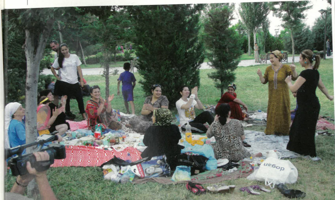
Na místní oslavu narozenin jsme zapadli perfektně

Tak jo, jsme na vyschlém dně, jedeme na západ a doufáme, že narazíme na cestu, co nás vyvede naším směrem k vesnici Akespe. Překonáváme vyschlá koryta řek, písčná pole, padáme, zvedáme se a snažíme se vyjet na útes. Voda nám začíná rapidně ubývat a my se škrábeme nahoru. Nevím, po kolika nezdarech se nám podaří najít místo, kde motory našich strojů pokoří písek a převýšení.