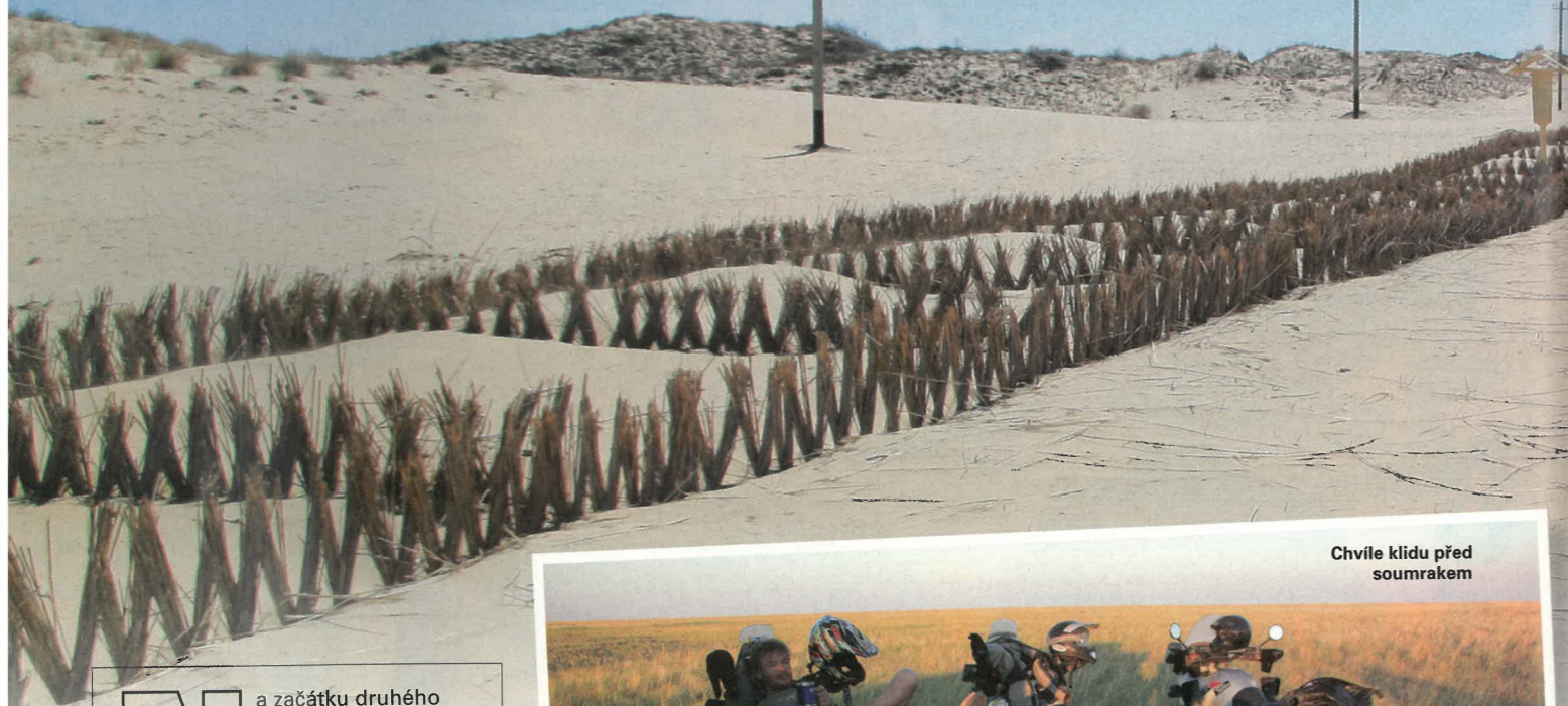
Chvilku klidu před soumrakem