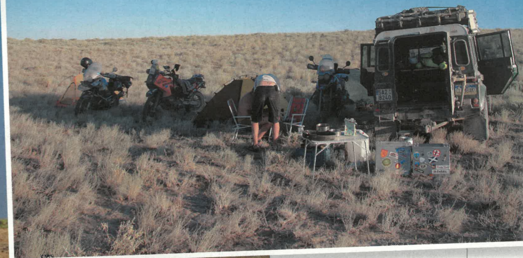
Každodenní rutina ve stepi

někým jiným, taky rychlou jízdou. Říkám mu, že jsem jel pomalu a že za nehodu může stav komunikace. Moje výpověď se nemění ani po dvou hodinách jeho odchodů a příchodů a konečně přináší protokol k podpisu. Mezitím volám domů a sděluji ženě tu „radostnou“ událost.