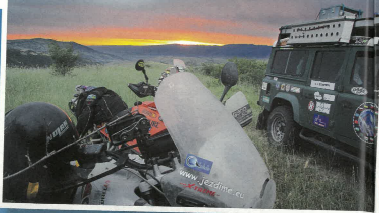
Kousek tam je Kyrgyzstán